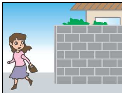
危ない場所から離れて！