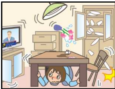
頭を守って、安全な場所に避難！

緊急地震速報を見聞きしたときの行動は、まわりの人に声をかけながら「周囲の状況に応じて、あわてずに、まず身の安全を確保する」ことが基本です。