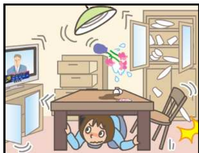
頭を守って、安全な場所に避難！

緊急地震速報を見聞きしたときの行動は、まわりの人に声をかけながら「周囲の状況に応じて、あわてずに、まず身の安全を確保する」ことが基本です。