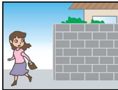
危ない場所から離れて！