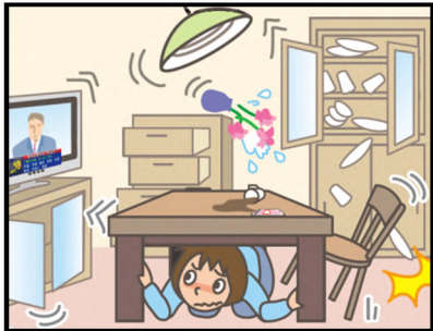
頭を守って、安全な場所に避難！

緊急地震速報を見聞きしたときの行動は、まわりの人に声をかけながら「周囲の状況に応じて、あわてずに、まず身の安全を確保する」ことが基本です。