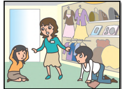
お店では、あわてず係員の指示に従って！